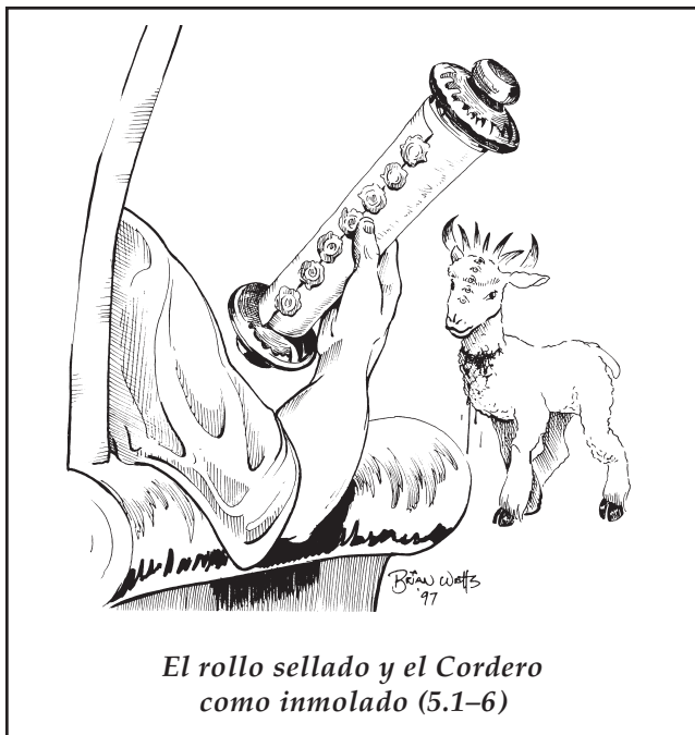
El rollo sellado y el Cordero como inmolado (5.1–6)