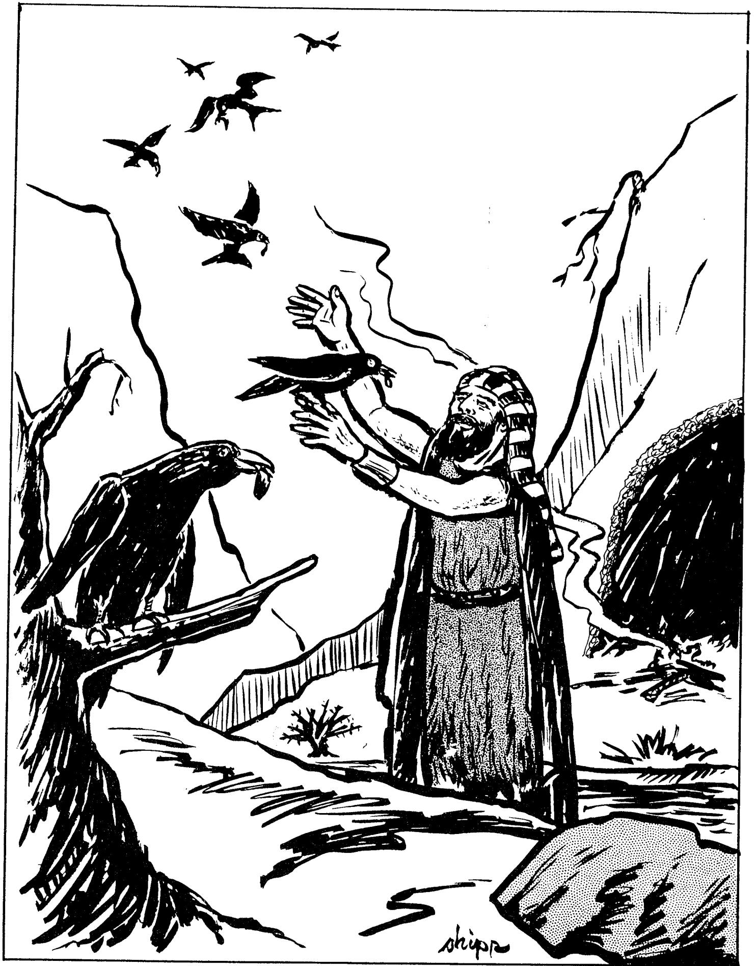
EL PROFETA ELIAS