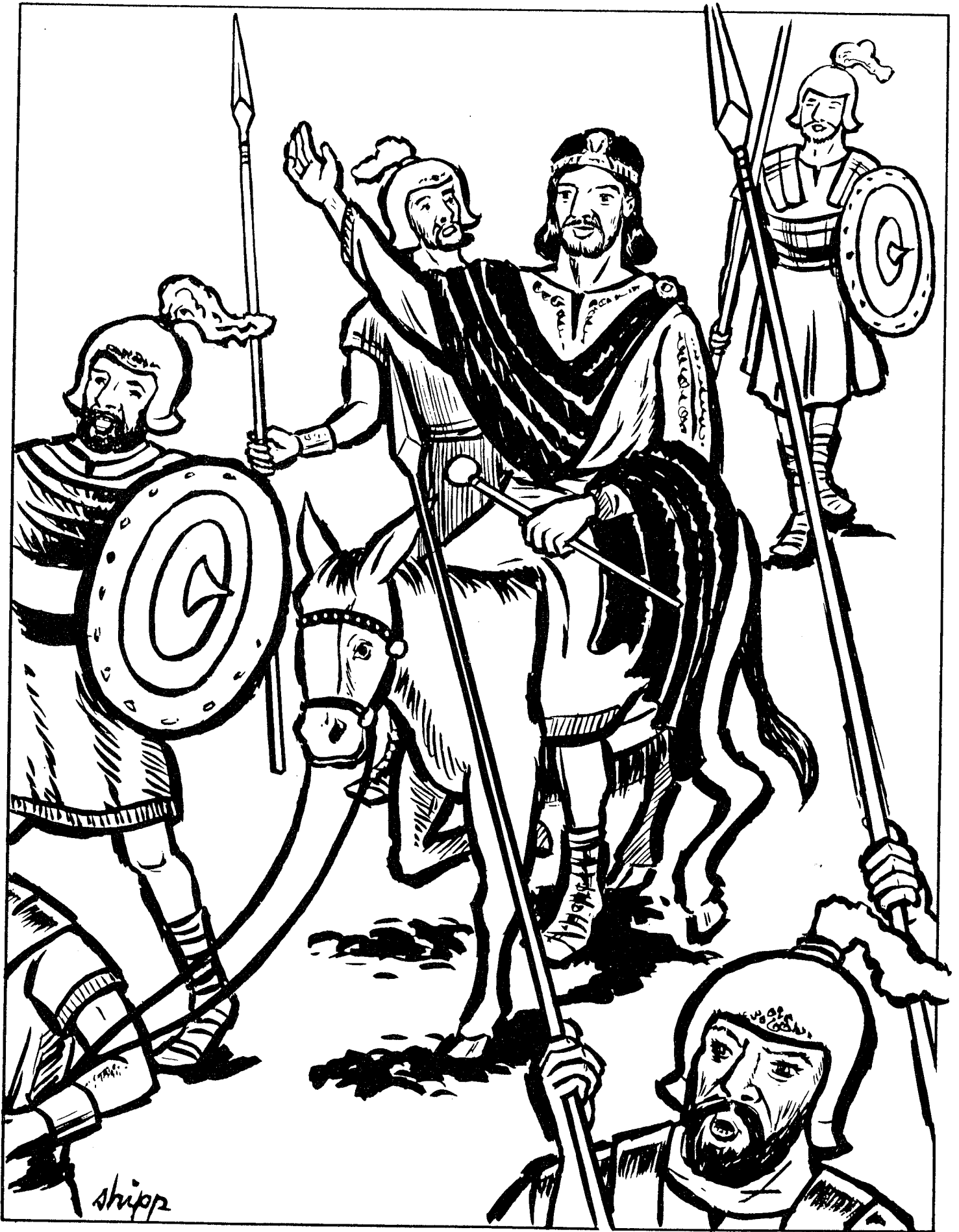
SALOMON OCUPA EL TRONO DE DAVID