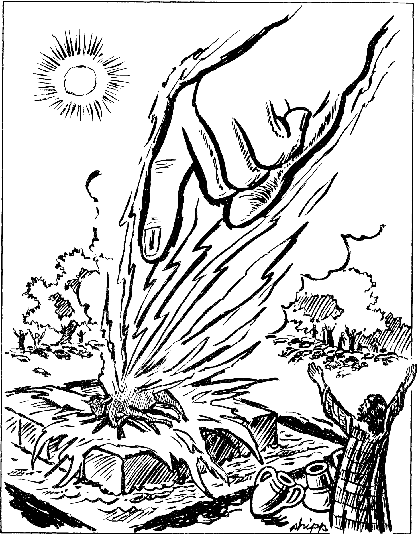
LA VICTORIA DE ELIAS SOBRE BAAL