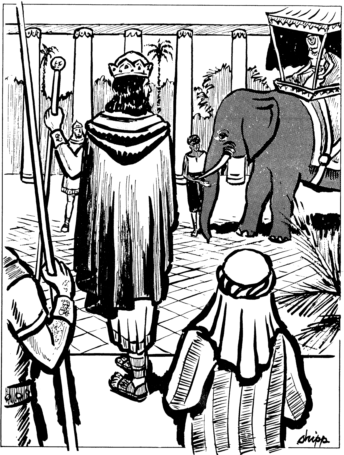
SALOMON, UN REY RICO, SABIO Y NECIO

1 Reyes 4:29-34; 9:10-28; 10:1-29; 11:1-43