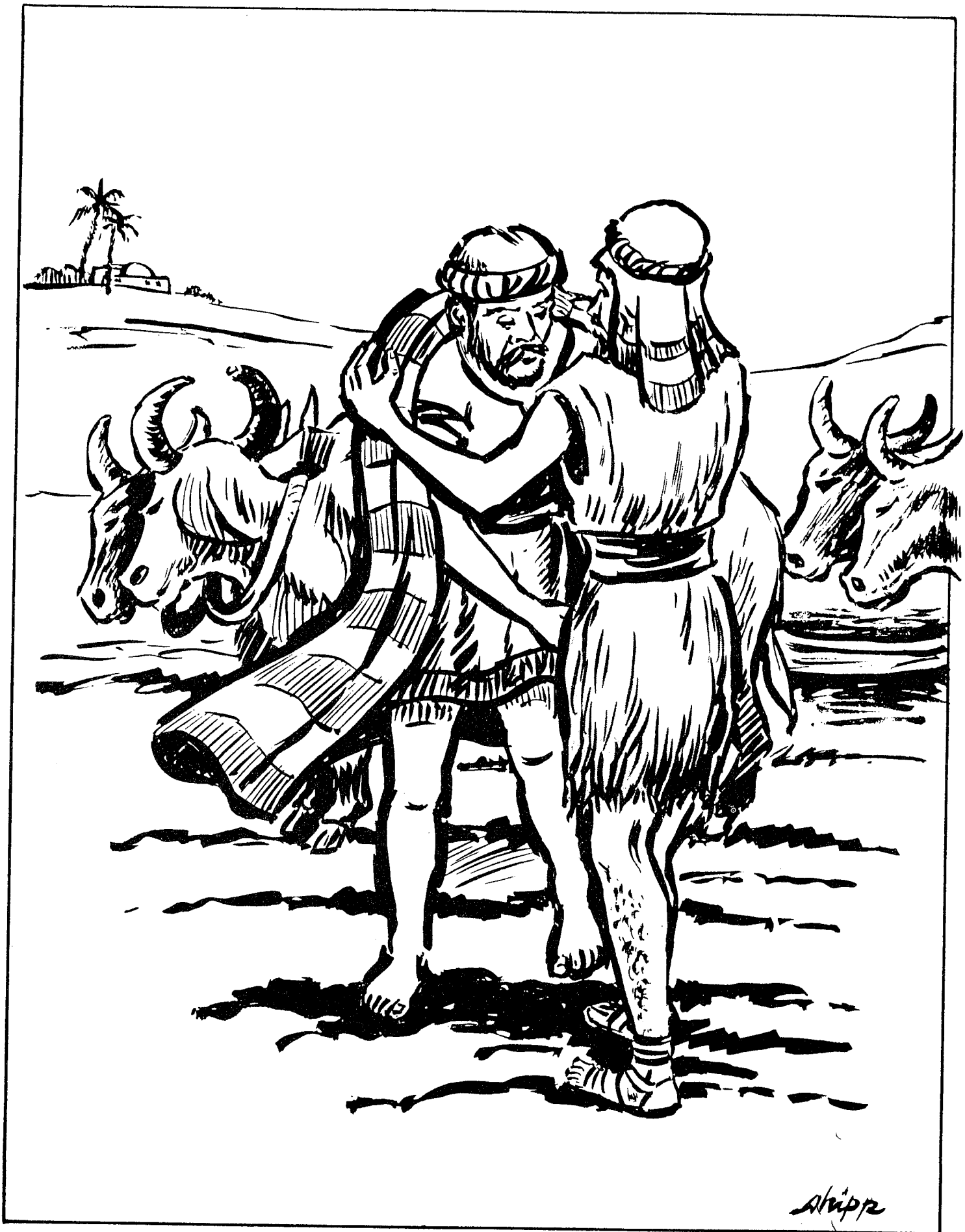
ELISEO Y EL REY ACAB