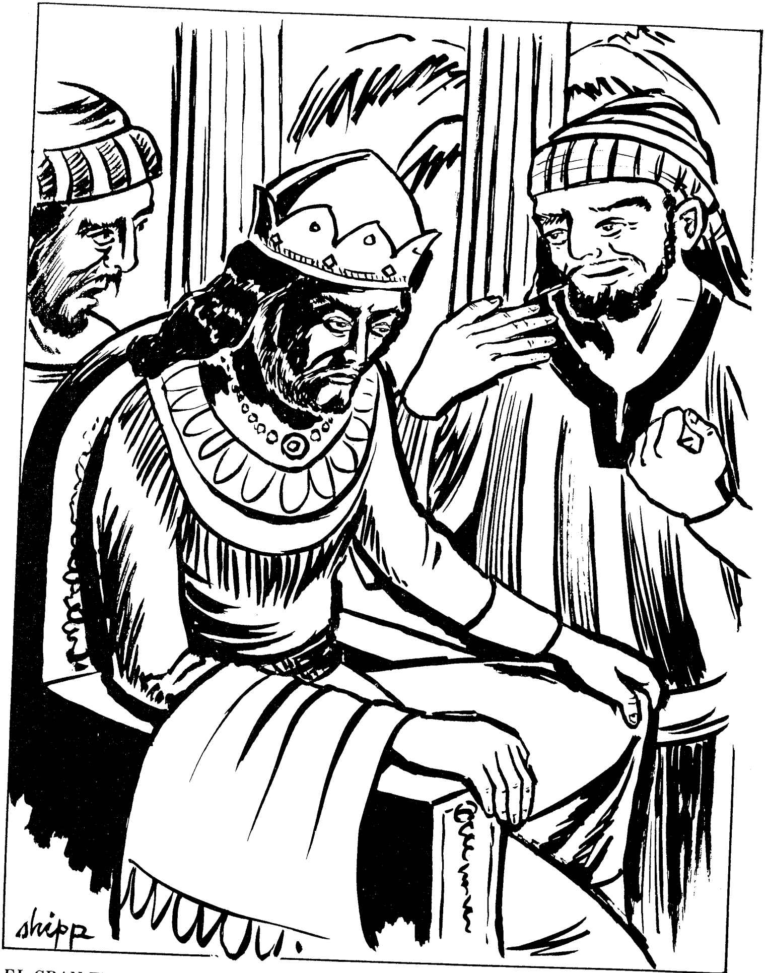
EL GRAN ERROR DE ROBOAM