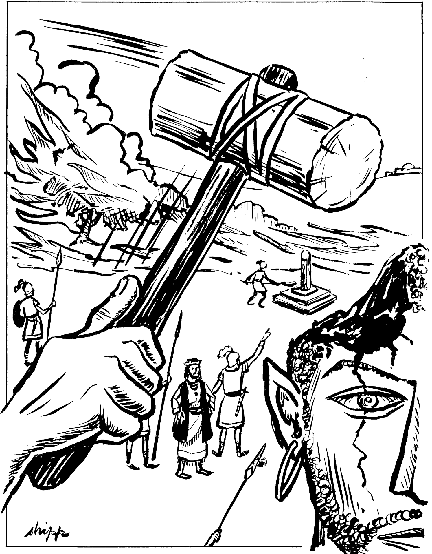
REYES BUENOS Y MALOS