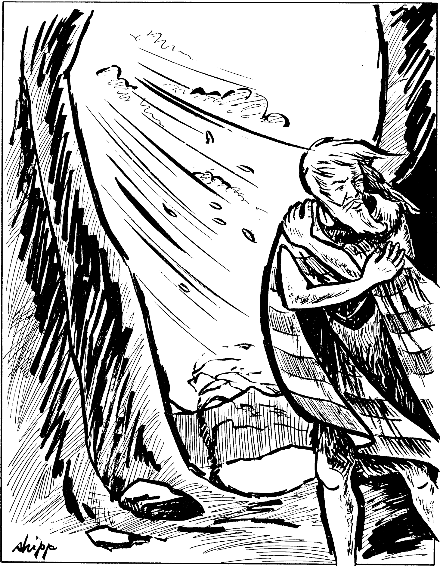
ELIAS HUYE DE LA VENGANZA DE JEZABEL