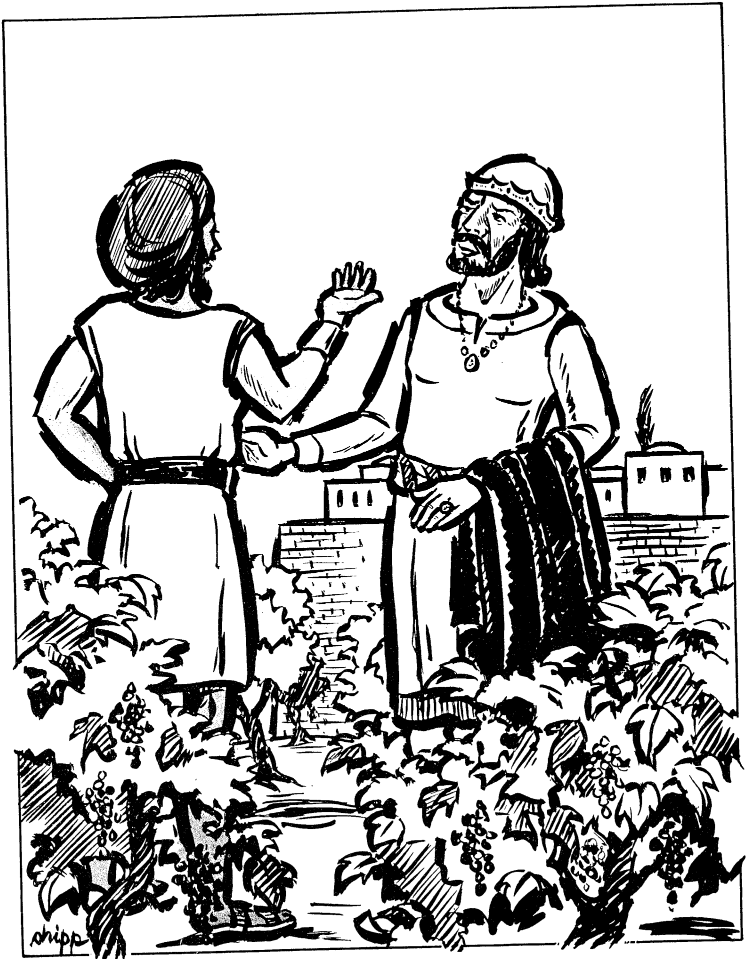
LA VIÑA DE NABOT