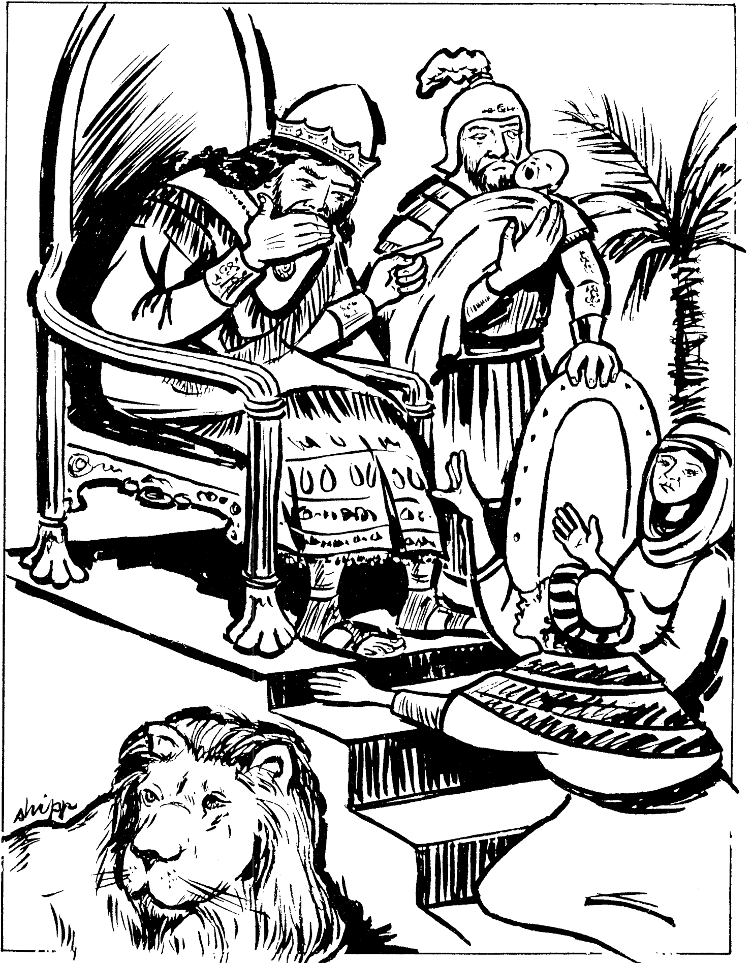
LA SABIDURIA DE SALOMON