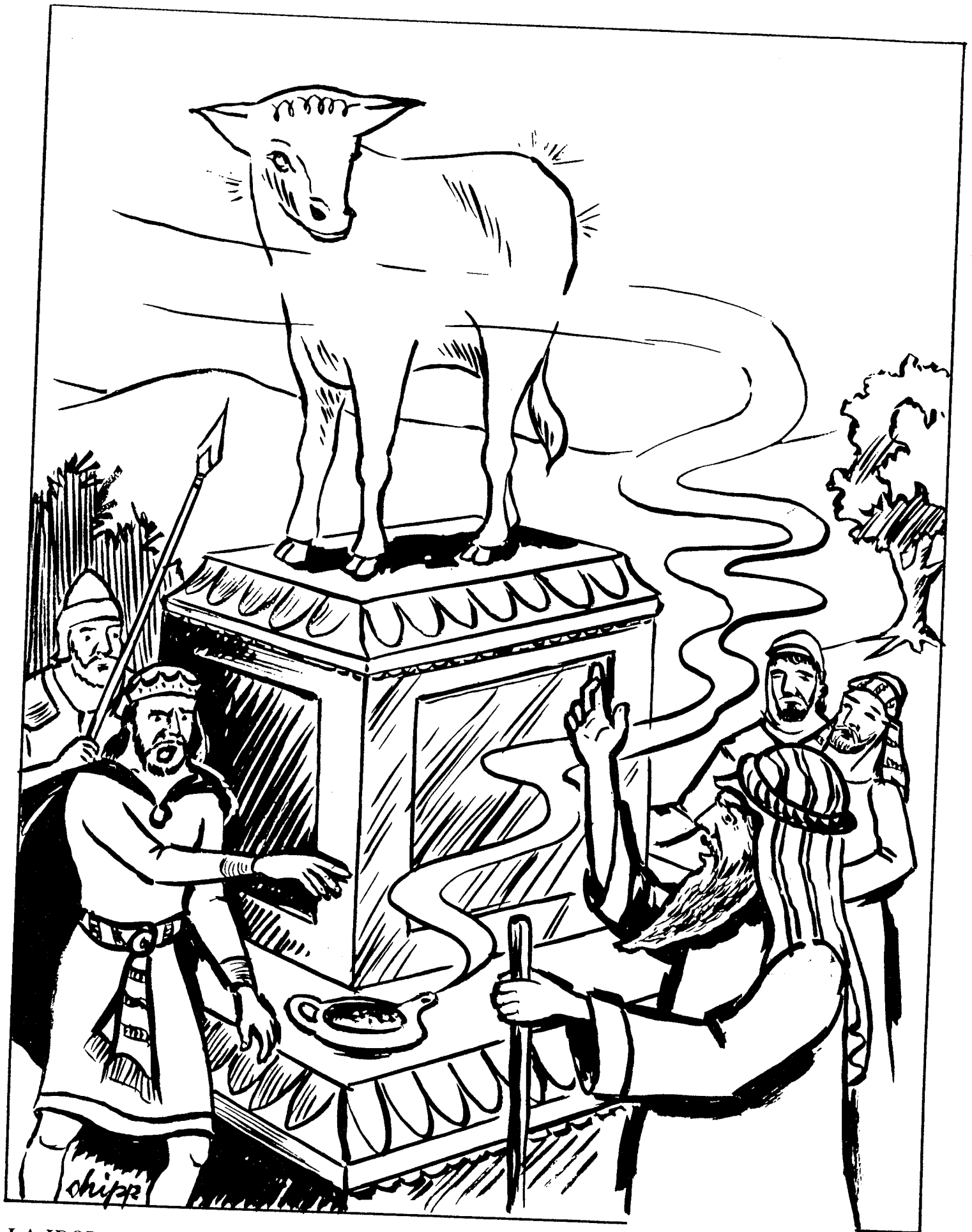
LA IDOLATRIA DE JEROBOAM